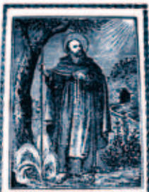
Sant Magí Martir Glorios que s' venera en sa propia Capella de la Ciutat de Gersens