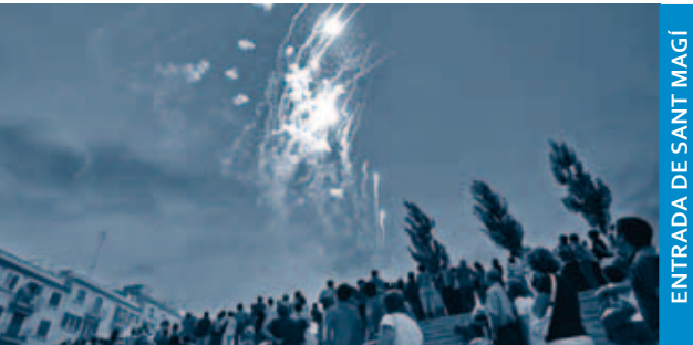
ENTRADA DE SANT MAGÍ