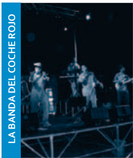
LA BANDA DEL COCHE ROJO