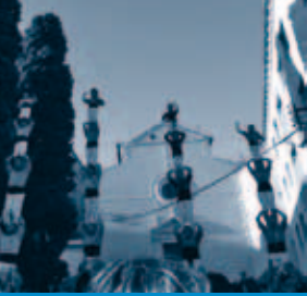
SALUTACIÓ A L'AIGUA